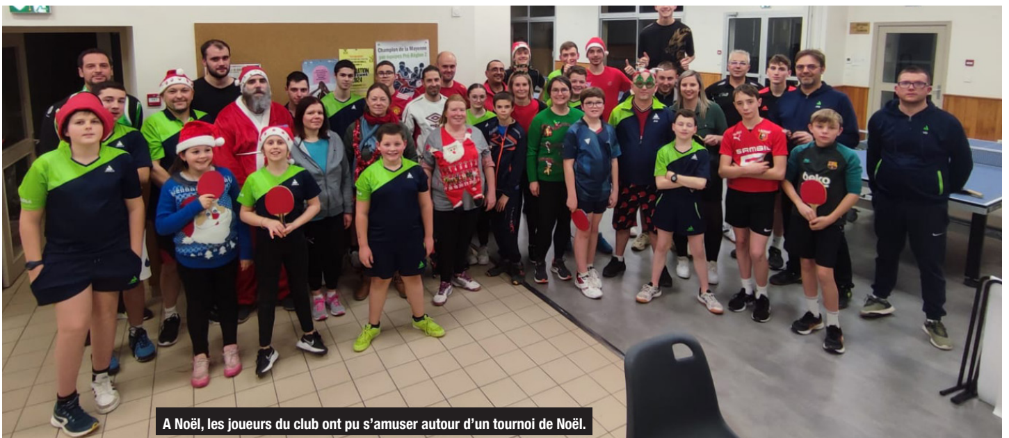
A Noël, les joueurs du club ont pu s'amuser autour d'un tournoi de Noël.