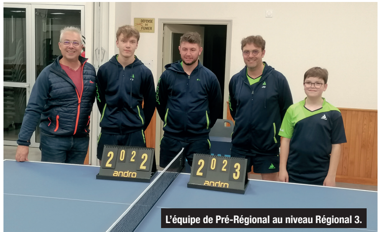
L'équipe de Pré-Régional au niveau Régional 3.