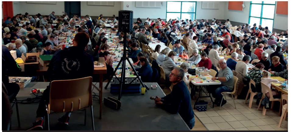
Notre loto du 11 novembre a été une réussite, merci aux participants !